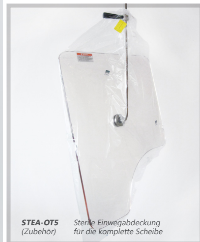
STEA-OT5 (Zubehör) Sterile Einwegabdeckung für die komplette Scheibe

Artikelnummern: OT50001 OT90001 E-OT25B05