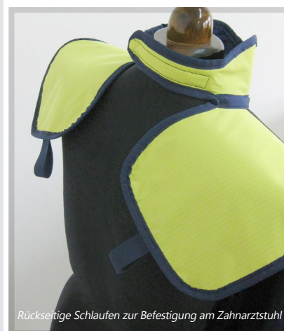
Rückseitige Schlaufen zur Befestigung am Zahnarztstuhl