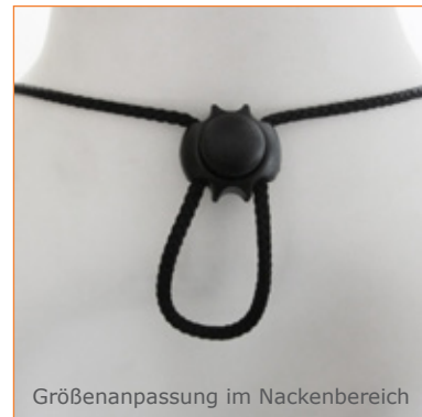
Größenanpassung im Nackenbereich

Artikelnummer: RP271 Brustdrüsenchutz für die Pädiatrie